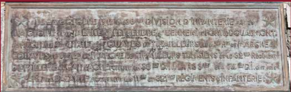
Plaque commémorative de la prise du fort de Douaumont par la 38 e division d'infanterie, 24 octobre 1916.