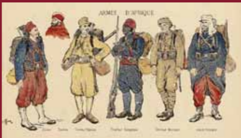
« Tenue de campagne : (...) armée d'Afrique », 1914 Histoire illustrée de la guerre du droit, d'Émile Hizelin, Paris, libr. A. Quillet, 1916, tome 1. Arch. nat., Bibl. hist., 10640/1.

19h30 Bilan et cocktail final (sur invitation) Université de Paris 1–Panthéon-Sorbonne, en présence de son président, Georges HADDAD