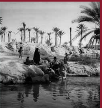
Scène de fleuve, Tozeur (Tunisie), cliché Pierre Boucher (Alliance) pour la direction du Tourisme, vers 1920. Arch. nat., 20000335/41. © Archives nationales (France).